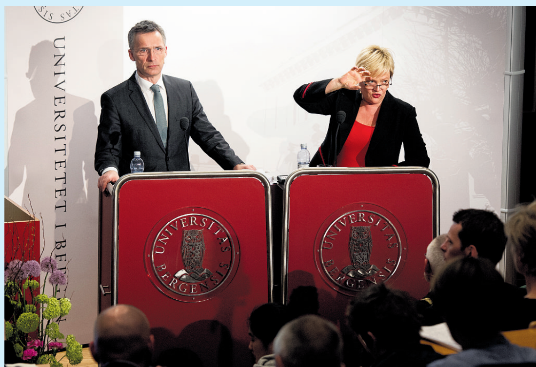
Statsminister Jens Stoltenberg og kunnskapsminister Kristin Halvorsen la sist fredag frem forskningsmeldingen under et møte ved Universitetet i Bergen.